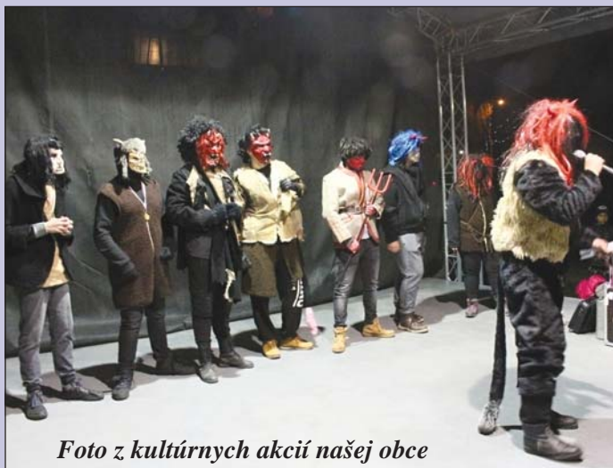
Foto z kultúrnych akcií našej obce