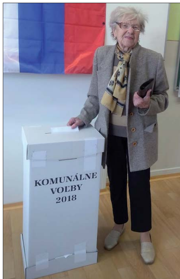
Volieb sa zúčastnila aj naša 100-ročná obyvateľka