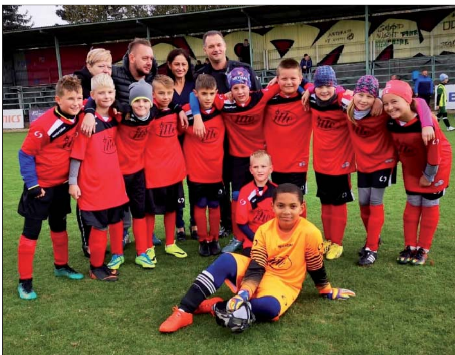
Prípravka „U11“ sezóna 2018 / 2019