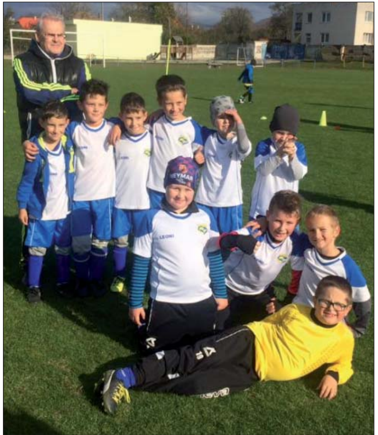
Prípravka „U9“ sezóna 2018 / 2019